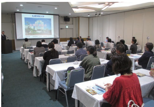
(地方会場の全体説明会の様子)

昨年度参加された保護者の皆さまより、以下のご意見を頂いております。今年度につきましても多数のご参加を心よりお待ちしております。