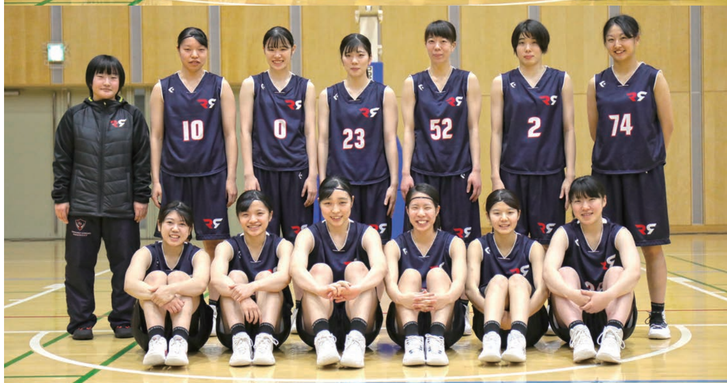
バスケットボール部は「第71回全日本大学バスケットボール選手権大会（2019年12月・東京）」に男女揃って出場しました。