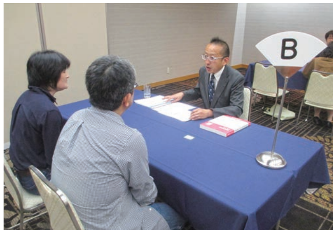
(地方会場の個別相談の様子)